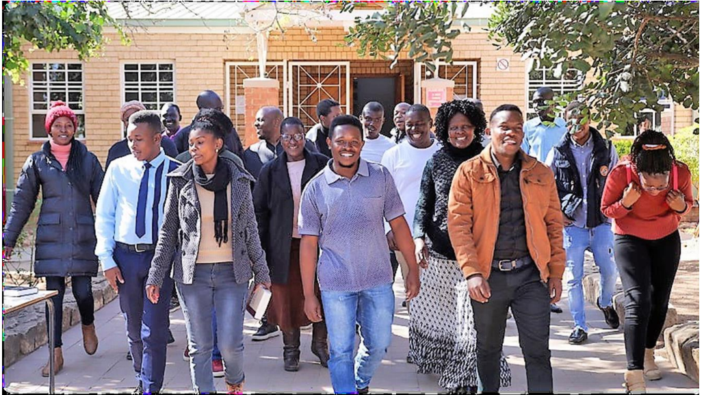
Studenten van Mukhanyo

verbetering van de kwaliteit van het lesmateriaal, uitbreiding van de regionale programmacoördinatie en door invoering van betere ondersteuningssystemen.